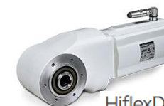
HiflexDRIVE: Versione asettica