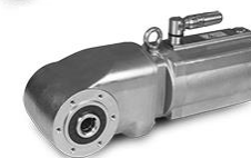
Versione in acciaio inox