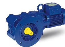
Motoriduttori a coppia conica