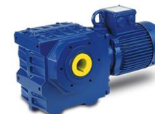
Motoriduttori a vite senza fine