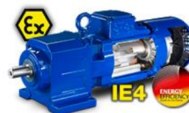
Soluzioni a risparmio energetico per aree a rischio di esplosione