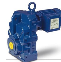
Motoriduttori ad assi paralleli