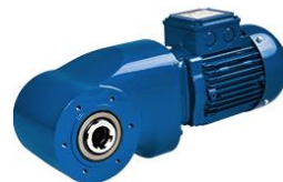
HiflexDRIVE: Design Standard