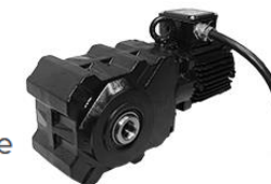
Motoriduttore IP68 per funzionamento in sommersione